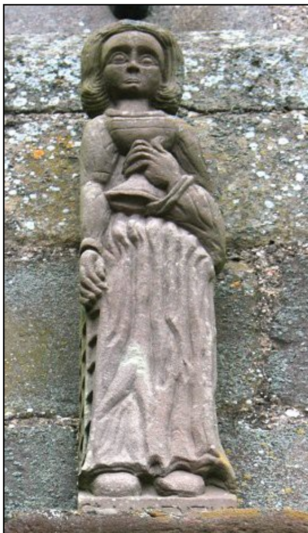
statue de Saint Laurent patron de l'église abbatiale placée au-dessus de la porte d'entrée de l'église

Ce projet a déjà été débattu avec Mme l'architecte des bâtiments de France qui nous suit bien. Une étude paysagère sera réalisée par une entreprise spécialisée et elle pourra, sans doute, vous être présentée dans le prochain bulletin de Janvier 2016. A titre de renseignement, vous pouvez visiter les cimetières de VOYER ou de HILSPRICH qui ont déjà réalisé une telle opération. La mairie reste à votre écoute pour toute suggestion.