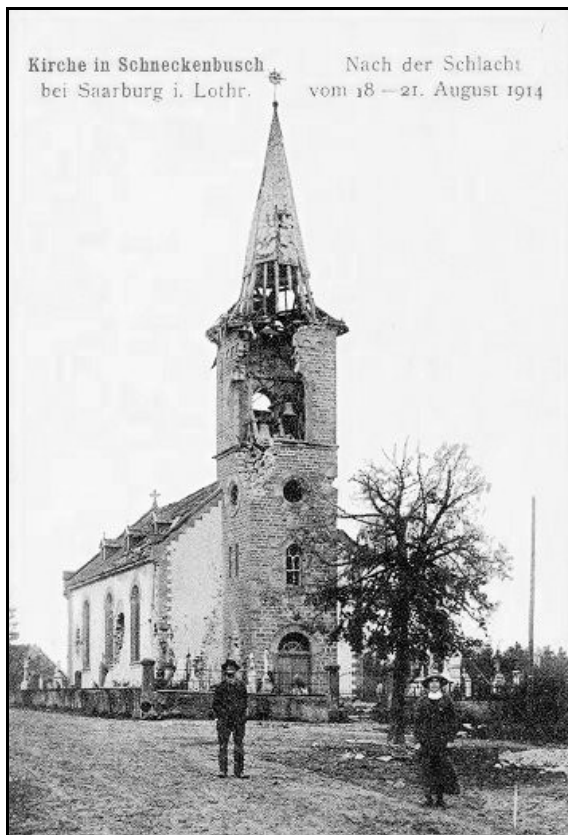
L'église de SCHNECKENBUSCH après le 20 août 1914