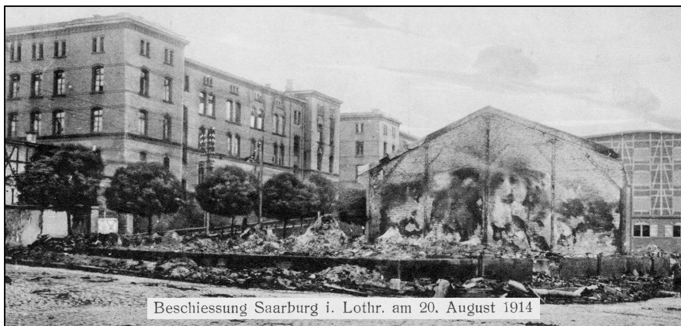
SARREBOURG : la caserne des uhlands après le 20 août 1914

Documentation et rédaction : M-O. Zdravic