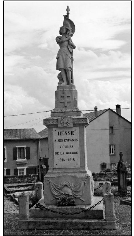
Renseignements fournis par Lætitia Geoffroy :

Une plaque apposée sur le monument aux morts de Hesse commémore le souvenir des dix Hessois victimes du bombardement du 20 août 1914.